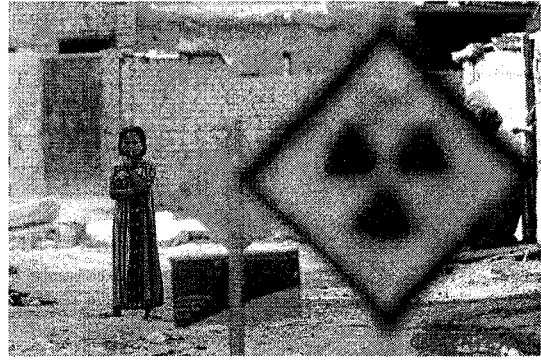
ดูเวท่า ในอิรัก เยื่อสารกัมมันตรังสีจากการโจมตีของสหรัฐ