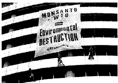
กรีนพีซแขวนป้ายประท้วง มอนซานโต ที่ทำให้เกิดการปนเปื้อนพันธุกรรม