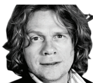
VEILE LID LARSEN [Forfatter]

Da jeg ringte på, tok det lang tid før noen åpnet: De stirret mistenksomt og skremt på meg.