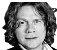
VEILE LID LARSEN [Forfatter]

Da jeg ringte på, tok det lang tid før noen åpnet: De stirret mistenksomt og skremt på meg.