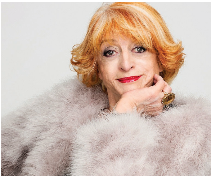
Styling: Janne Skarpeid Hermansen, Jakke fra Ravn

Verden der ute er viktigere enn deres egen. Hun forteller at noen unge til og med foretrekker å svare på mobilen selv om de befinner seg i samme rommet som venner eller familie, fordi de føler seg mer komfortable, kanskje tryggere, når de forholder seg til mobilen. Hun konkluderer med at teknologi får oss til å glemme hva vi vet om livet.