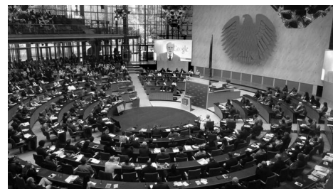
Global Media Forum 2014 arrancou esta segunda-feira (30/06/14) em Bona