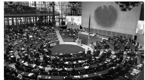
Global Media Forum 2014 arrancou esta segunda-feira (30/06/14) em Bona