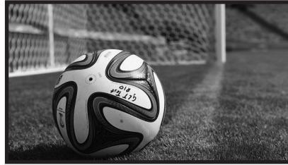
teknologi garisan gol