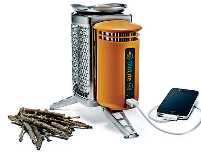
Figura 6: Estufa Biolite