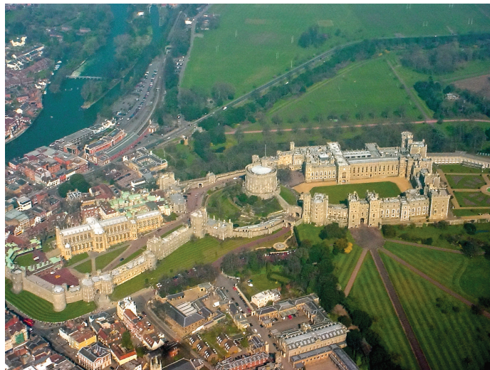
Figura 1: Castillo de Windsor