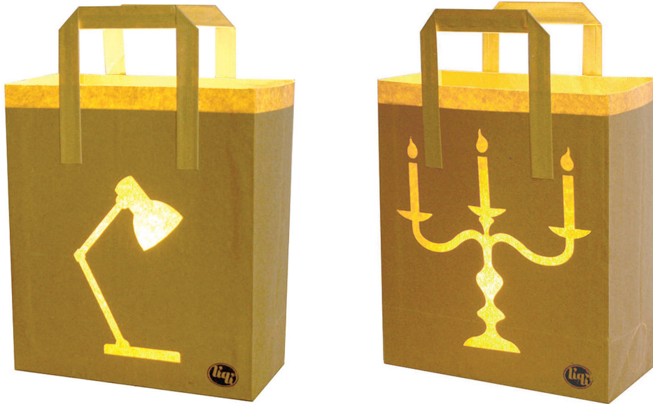
Figura 7: Lámpara de mesa Bagalight