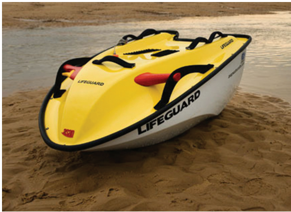
Figura 8: Prototipo de la moto acuática salvavidas