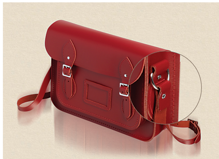
Figura 5: Detalle de la unión de la correa con el bolso