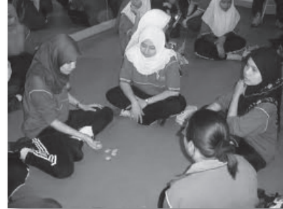
Permainan Batu Seremban