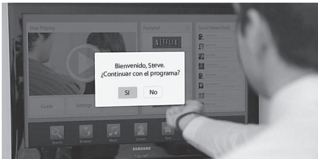
Figura 3: Autenticación del usuario de LOKI