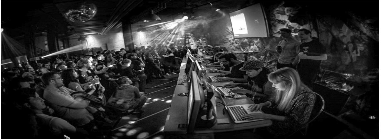
Fredag kväll i ett bergum i centrala Stockholm

Kodning som Extremsport, en sällsynt nördig tävling och en växande publikmagnet som pågått i några år och även hållits i New York och Paris.