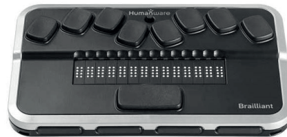
Figura 2: Teclado en Braille

Varias empresas han desarrollado recientemente teclados en Braille, como el que se muestra en la Figura 2 . Los teclados en Braille usan diferentes combinaciones de las nueve teclas principales para formar caracteres.