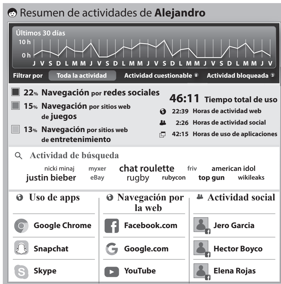
Figura 1: Ejemplo de un informe semanal que se puede enviar a los padres