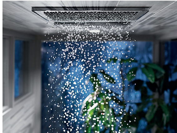
Figura 7: Ducha Kohler Real Rain

Estudiando todos los elementos de una ducha con lluvia natural, desde la variedad de tamaño de las gotas hasta los ángulos desde los que caen, Kohler ha creado Real Rain, una experiencia en la ducha que transporta al usuario más allá del evento diario. La lluvia suele ser un iniciador de conversaciones.