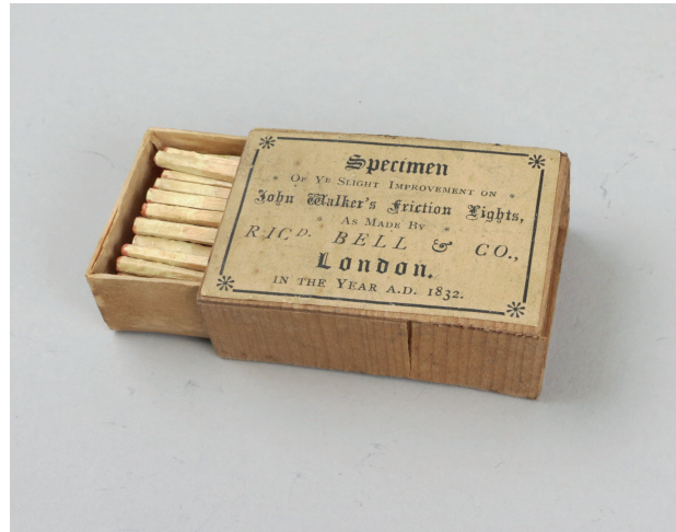
Figura 5: Las cerillas "Friction Lights"