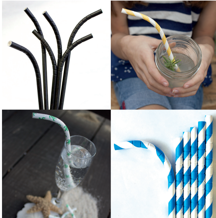
Figura 2: Paja Eco-Flex