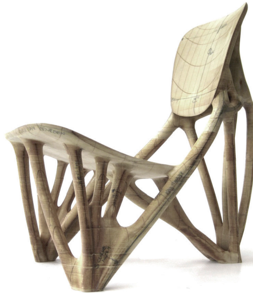
Figura 3: Silla Bone de papel

[Fuente: con autorización de Joris Laarman]