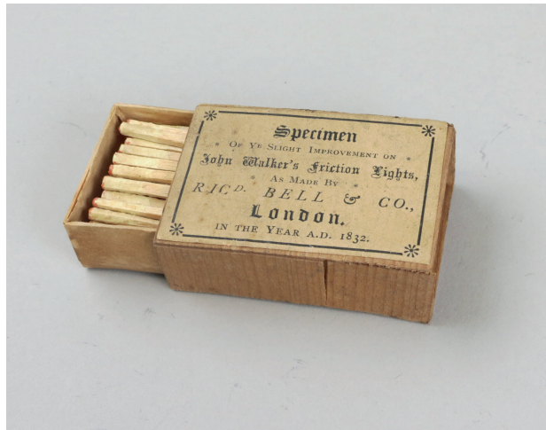
Figura 5: Las cerillas "Friction Lights"