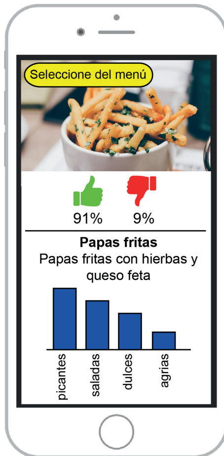
Figura 1: App Tasty