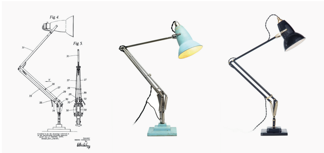
Figura 5: Lámpara Anglepoise