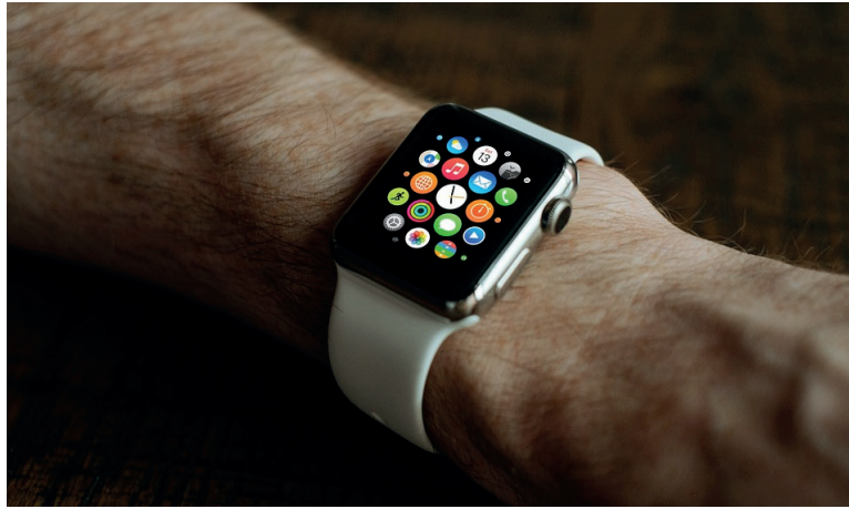
Figura 8: Un smartwatch