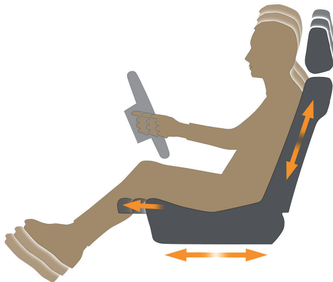
Figura 2: Gráficos en 2D de la ergonomía del interior