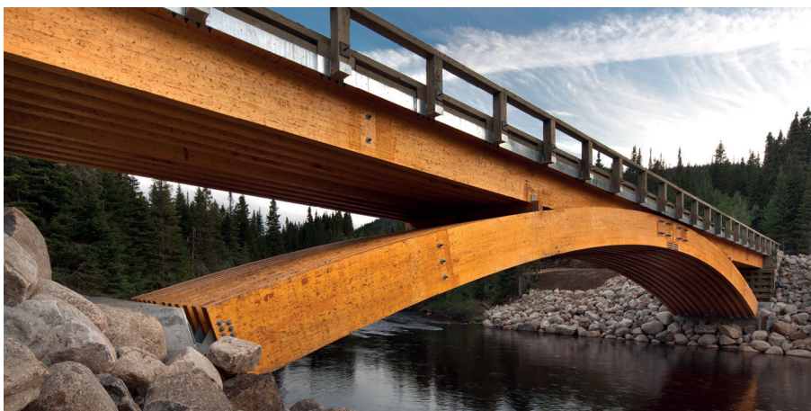
Figura 7: Puente de madera

En otros casos, los diseñadores de puentes han usados materiales tradicionales como madera. En la figura 7 se muestra un puente de madera en Canadá.