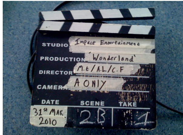
Figura 4: Claqueta tradicional