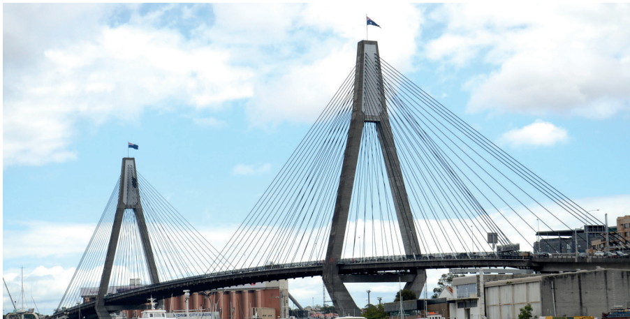
Figura 6: Puente Anzac