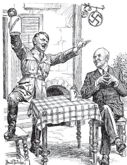
PROSIT! HERR HITLER. "THE MORE WE ARM TOGETHER THE PEACEFULER WE'LL BE!" SIR JOHN SIMON. "WELL—ER—UP TO A CERTAIN POINT—AND IN CERTAIN CASES—PROVISIONALLY—PERHAPS."

Herr Hitler : « Plus nous nous armons ensemble, plus nous serons en paix ! » Sir John Simon : « Et bien – euh – jusqu'à un certain point – et dans certains cas – provisoirement – peut-être. »