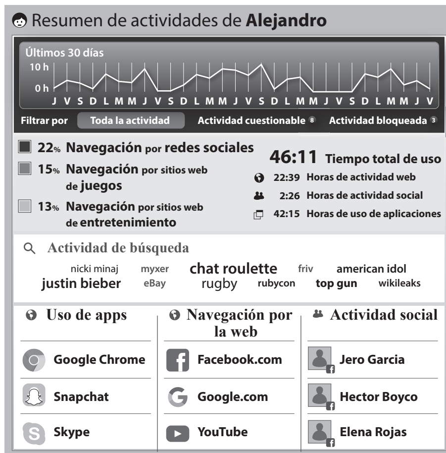
Figura 1: Ejemplo de un informe semanal que se puede enviar a los padres