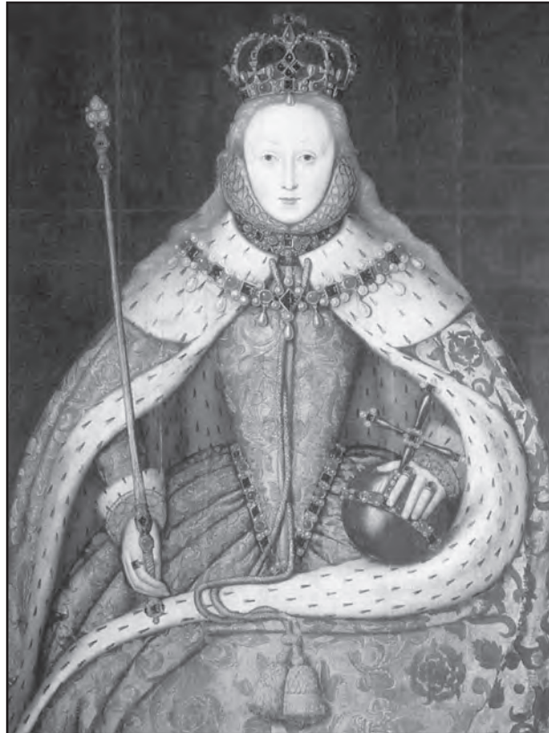
[Portread o Elisabeth a gafodd ei beintio ar gyfer ei choroni yn 1559]

Astudiwch y darlun isod ac yna atebwch y cwestiynau sy'n dilyn.