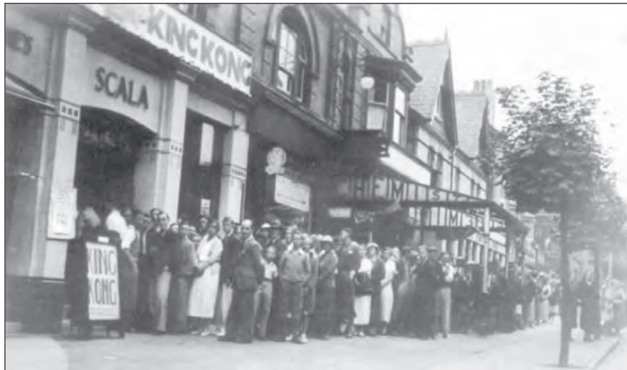
[Ffotograff o Sinema'r Scala ym Mhrestatyn, Gogledd Cymru, yn 1938]

Astudiwch y ffotograff isod ac yna atebwch y cwestiynau sy'n dilyn.