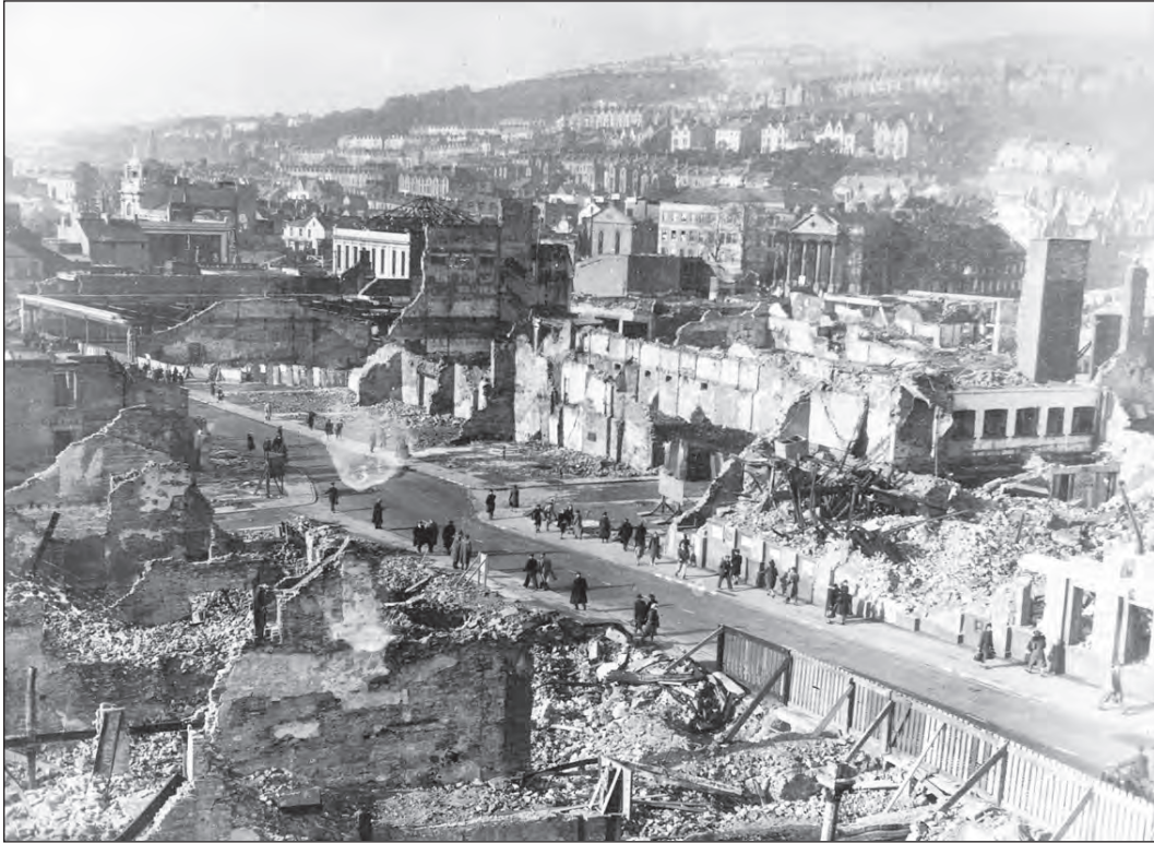
[Ffotograff o ganol dinas Abertawe yn 1948 ar ôl diwedd yr Ail Ryfel Byd, yn dangos y difrod a gafodd ei achosi gan y Blitz]

Astudiwch y ffotograff isod ac yna atebwch y cwestiynau sy'n dilyn.